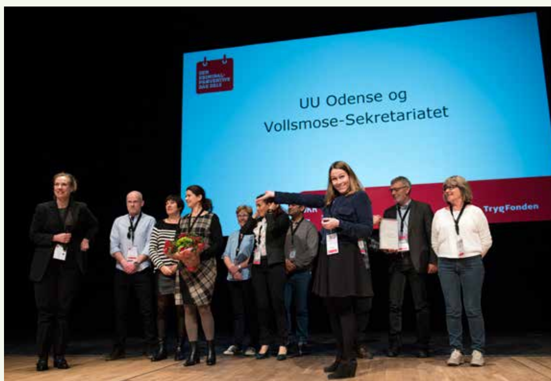
Vinderne af Den Kriminalpræventive Pris fik overrakt en check på 50.000 kr.

ge forebyggelse i "førstegangsfødende familier", på Nørrebro er der skabt et fritidsakademi, som skal gøre de unge parate til et fritidsjob, og i Nordjylland arbejder politiet med et nyt it-system, som skal få øje på og hjælpe familier, der er på vej ud i en social deroute.