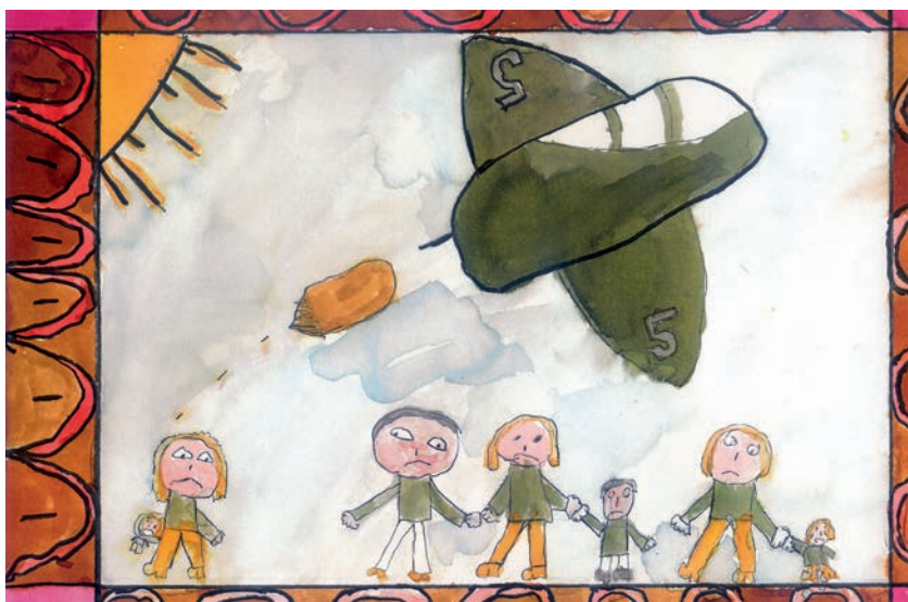
Elev i 4. klasse, projekt 'Born af Krig og Fred' 2011