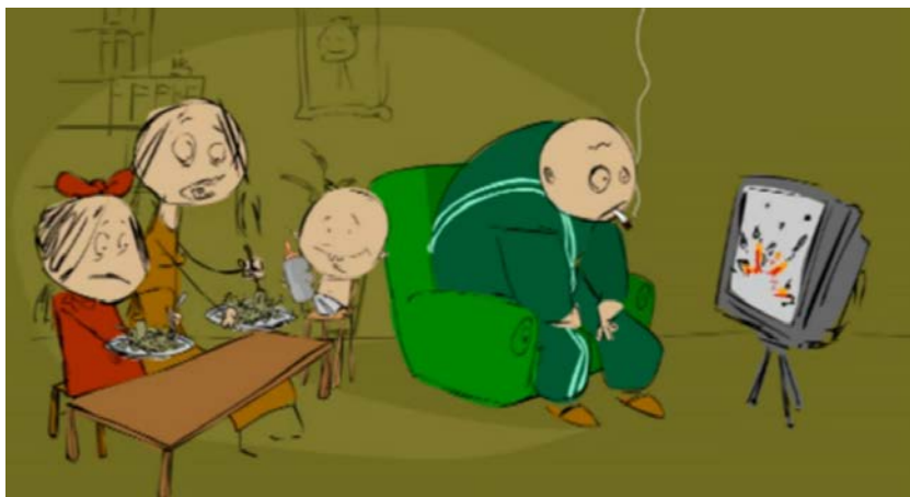
Stillbillede fra filmen 'Traumer i familien', traume.dk

Børn af traumatiserede forældre kan opleve, at forældrenes traumer videregives til dem gennem forældrenes reaktioner, symptomer og manglende følelsesmæssige nærvær og opmærksomhed. Er forældrene stressede og anspændte, vil børnene ofte være nervøse og på vagt. Også forældres detaljerede beretninger om grusomme oplevelser, såsom tortur, vold og overgreb, kan påføre barnet sekundær traumatisering. Derudover vil nyhedsudsendelser fra hjemlandet præge stemningen i hjemmet og dermed påvirke både forældre og børns psykiske tilstand.