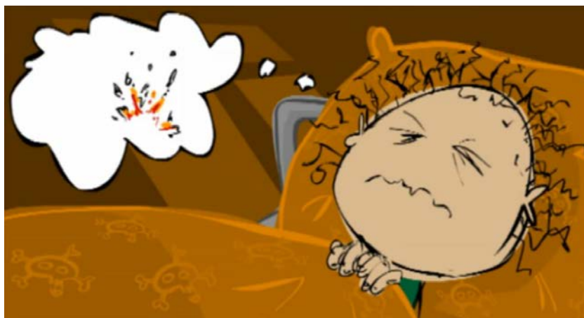
Stillbillede fra filmen 'Traumer i familien'

Diagnosen PTSD stilles til både børn og voksne. PTSD hos børn ligner den, der ses hos voksne, og omfatter ligeledes reaktioner inden for kategorierne stress, genoplevelser og undgåelsesadfærd. Symptomerne viser sig dog ofte på andre måder hos børn, afhængigt af barnets alder og udviklingstrin. Børn er særligt udsatte, og traumatiske oplevelser kan få betydning for deres emotionelle og kognitive udvikling. I det daglige arbejde med flygtningebørn er det derfor vigtigt at kunne genkende symptomer på traumer og PTSD, så der kan gribes ind med den rigtige hjælp i tide.