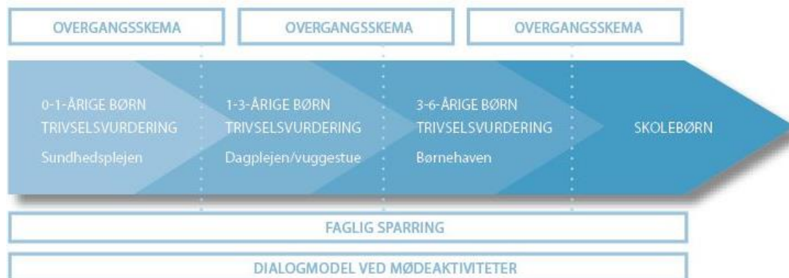
Figure 2.1 Den reviderede Opsporingsmodel

Valget faldt på disse fire metoder, da evalueringerne viste, at 1) det især var disse metoder, der med succes var blevet implementeret i de tidligere projektkommuner, 2) de havde vist gode resultater, og 3) de understøttede hinanden i opsporingen af samt den tidlige indsats over for børn med vanskeligheder (Mehllbye 2013; Rambøll 2013) (jf. figur 2.1). De grundlæggende værdier og teorier i den oprindelige opsporingsmodel er blevet fastholdt i forbindelse med udviklingen af den reviderede model (jf. tabel 2.4).