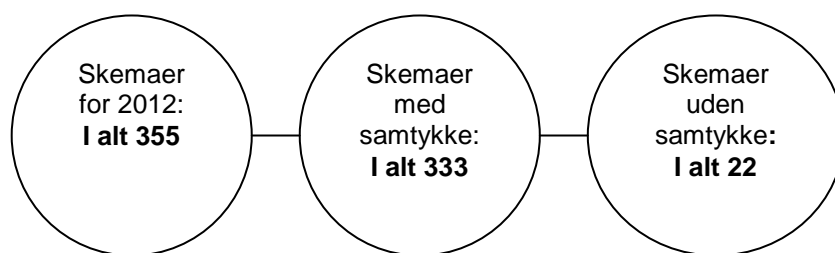
Figur 2. Oversigtsfigur for skemaer i 2012

Tabel 10 viser, hvordan de 333 behandlingsforløb fordeler sig på det enkelte center. Antallet af behandlingsforløb i de enkelte centre varierer fra ét (KRIS Hovedstaden) til 76 (Støttecenter mod incest) 1415 . Den store spredning i antal kan forklares med flere forhold, såsom geografi, centrenes størrelse, kapacitet og indhold. Nogle af centrene er alene baseret på frivillig arbejdskraft, mens andre centre fungerer med lønede psykologer og/eller psykoterapeuter tilknyttet.